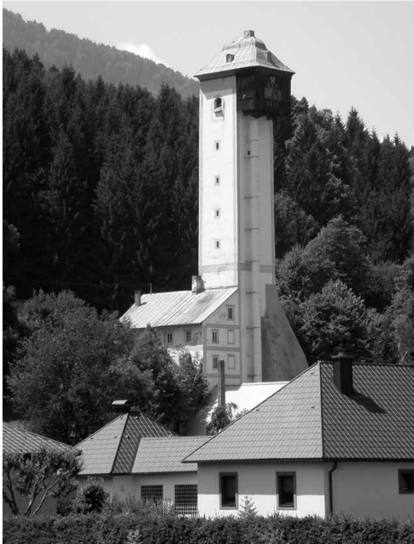
Abb. 1: Ehemaliger Standort des Fabrikschlosses „Fuggerau“, neuer Schrottturm