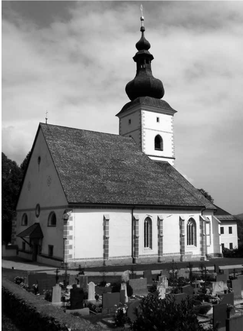
Abb. 2: Kirche Fürnitz, Wirkungs- und Begräbnisstätte von Adam III Fugger