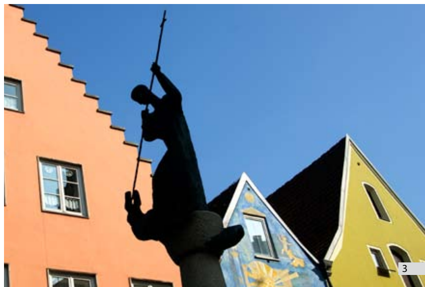
Stadtbrunnen mit Stadtpatron St. Magnus. A city fountain with patron saint St. Magnus. Fontana della città con il santo patrono, San Magno.